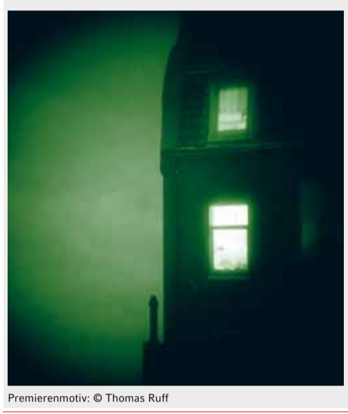
Premierenmotiv: © Thomas Ruff

PREMIERE DIE KAHLE SÄNGERIN – Kammeroper in einem Akt von Luciano Chailly Inszenierung Barbora Horáková, Bühnenbild Annett Hunger, Kostüme Benjamin Burgunder Ein Ehepaar sitzt gemütlich vor dem häuslichen Kamin. Man stellt fest, dass man in der Nähe von London lebt und Smith heißt. Später kommen noch die Martins hinzu und finden heraus, dass sie miteinander verheiratet sind. Auch der Feuerwehrrhauptmann und das Dienstmädchen Mary kennen sich schon und die kahle Sängerin – sie trägt noch immer die gleiche Frisur! »Die kahle Sängerin« ist Eugène Ionescos erstes Theaterstück (1950) und der Auftakt zum »Theater des Absurden«. Aus einer Ansammlung häuslicher Szenen voller Nonsens, Situationskomik, Pseudo-Klischees und pointenlosen Anekdoten formt sich ein »Anti-Stück« voller Sprachakrobatik und Witz. In Semper Zwei ist die 1986 in Wien uraufgeführte Opern-Rarität nun in der Deutschen Erstaufführung zu erleben.