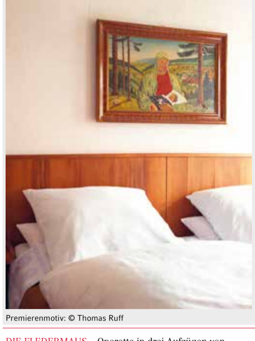
Premierenmotiv