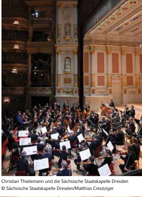
Christian Thielemann und die Sächsische Staatskapelle Dresden